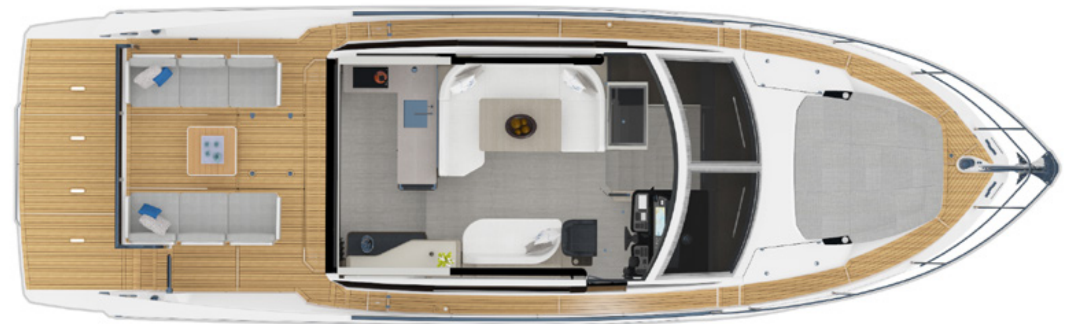
MAIN DECK | PONTE PRINCIPALE