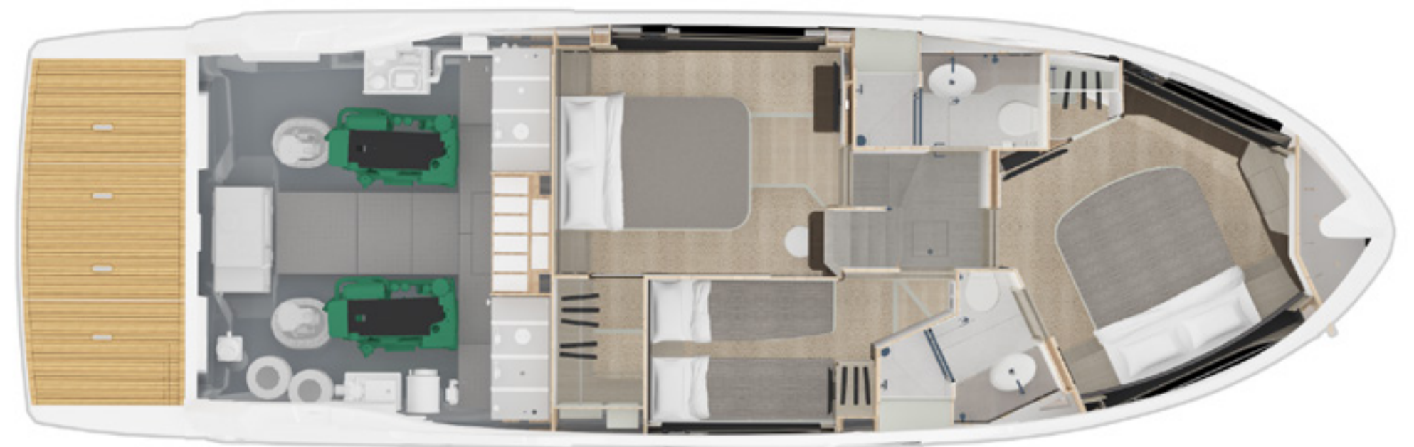
LOWER DECK | PONTE INFERIORE